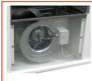
Ventilateur centrifuge haute pression silencieux - IP55 - Equipé avec grille anti-rongeurs.