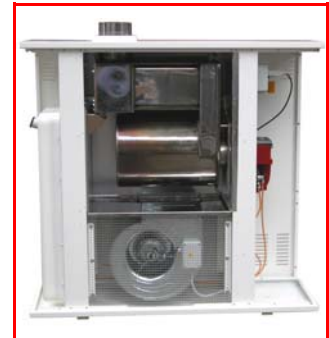
Accessibilité record à tous les composants du générateur pour une maintenance aisée (de 5 à 10 minutes pour accéder au ventilateur et à la chambre de combustion)