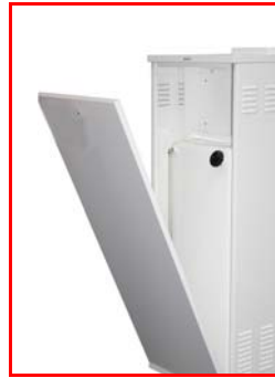
Porte d'accès au réservoir et à la jauge de carburant (à l'arrière)