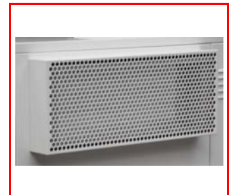
Grille de soufflage avec clapet anti-retour fermant automatiquement la grille à l'arrêt de l'appareil. Peut se monter du côté gauche ou du côté droit.