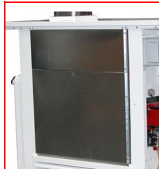
Doublement des panneaux de carrosserie pour éviter toute déperdition de chaleur et maintenir les panneaux extérieurs froids, supprimant ainsi tout risque de brûlures