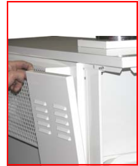
Fixation des panneaux par inserts afin de faciliter l'accès éventuel et éviter toute visserie extérieure