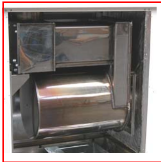
Chambre de combustion à retour de flamme et échangeur de chaleur à haut rendement en acier inoxydable