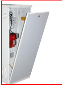
Porte d'accès au brûleur, à l'armoire de commande et au filtre fuel. (à l'avant)