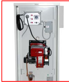
Compartiment technique avec armoire de commande IP55, brûleur fuel ou gaz, filtre fuel et thermostat de sécurité.