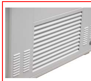
Grille pluie pare de reprise d'air extérieur. Peut se monter du côté gauche ou du côté droit en fonction du positionnement de l'appareil.