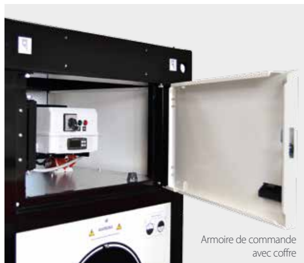
Armoire de commande avec coffre