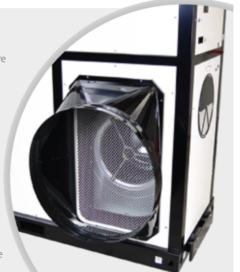
Adaptateur pour reprise d'air (option)

SOVELOR® Tél. 04 78 47 11 11 - Fax 04 78 43 48 82 - info@sovelor.fr