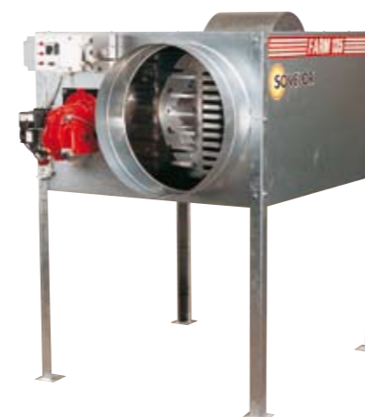
Option pieds (FARM 80 - 105 - 135)