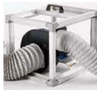
V1 raccordé sur gaines d'aspiration et de soufflage.